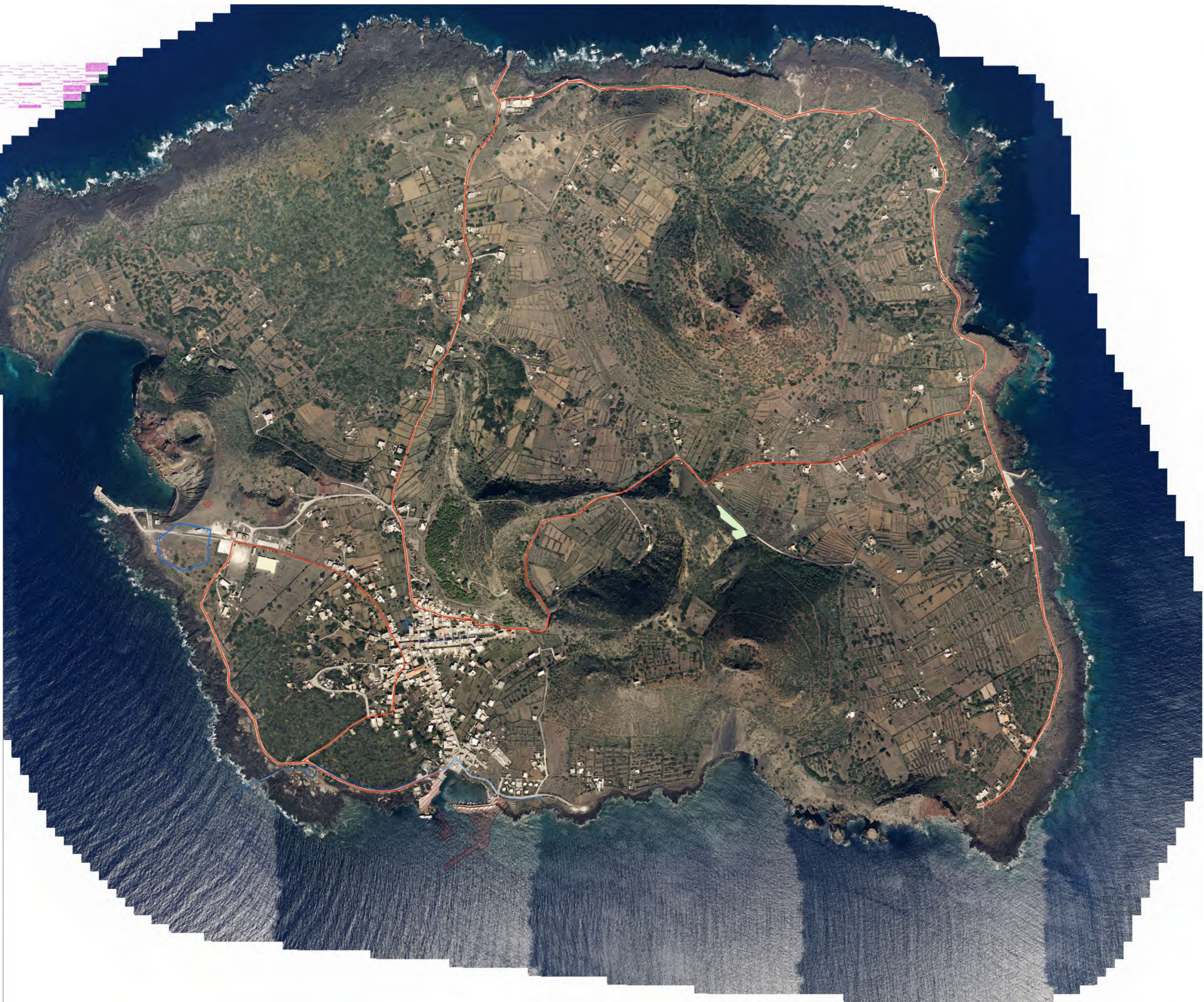
Isola di Linosa Carta degli interventi inseriti nel piano triennale delle opere pubbliche